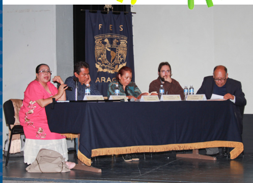
Panel La interculturalidad en los programas de educación superior.

Como parte del programa se realizaron dos Conferencias Magistrales: México nación multicultural y La educación intercultural en México . La primera presentada por el etnólogo Del Val Blanco donde expuso los aspectos fundamentales de este proyecto docente de la UNAM, surgido a partir del planteamiento acerca de cual es la relación existente entre la Universidad y los pueblos indígenas de México. El resultado fue un profundo análisis que develó información relevante, pues sólo en un pequeño grupo de académicos del más alto prestigio, se encontraba “toda la comprensión universitaria sobre la problemática de los pueblos indígenas”. Ante dicha situación se decidió crear este programa el cual “nació como un espacio