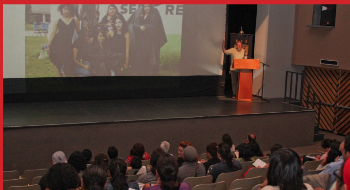
Conferencia Magistral del Dr. Gunther Dietz.

en la solución de los conflictos socioeconómicos y políticos de México y Centroamérica. Este posgrado ha profesionalizado a estudiantes indígenas chiapanecos, al reconocer el valor de las lenguas autóctonas como requisito equivalente al idioma inglés para ingresar a los estudios de Maestría.