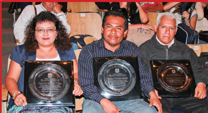
Reconocidos por concluir sus estudios de doctorado.